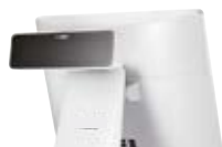
Display Cliente • VFD (2 Linee x 20 Caratteri)