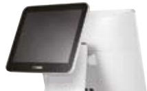
Secondo Display • 9.7", 15" LCD